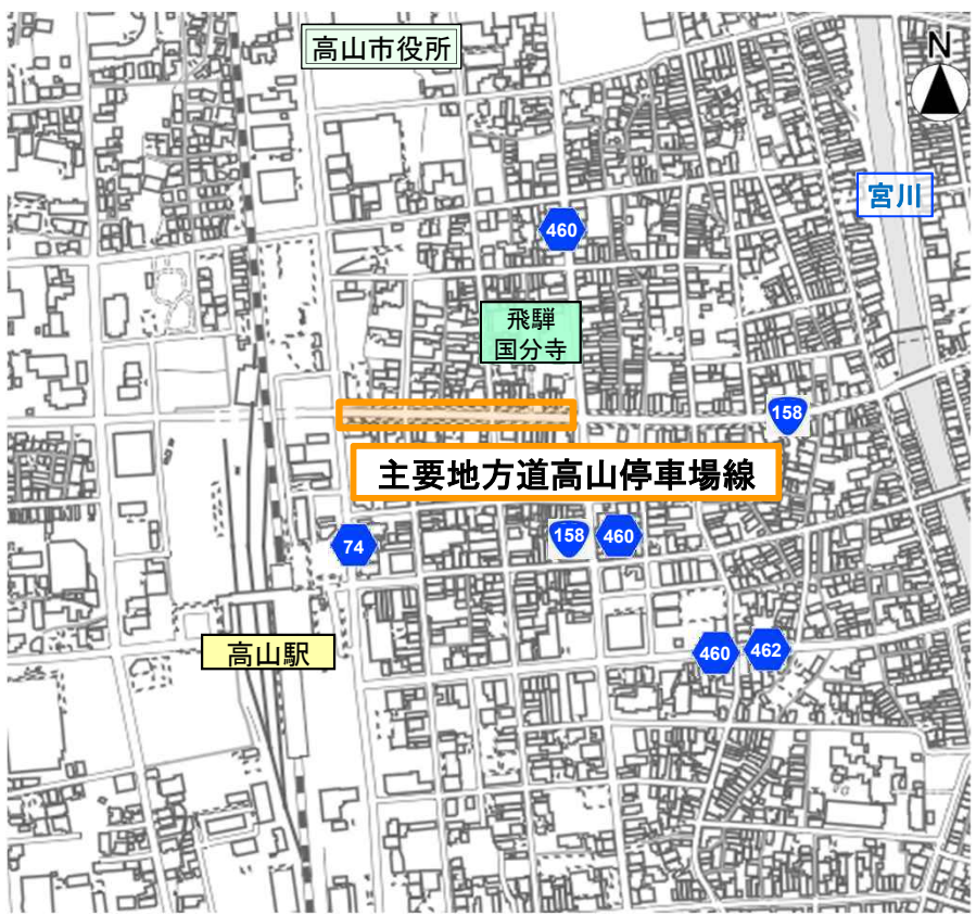
橙囲: 歩行者利便増進道路