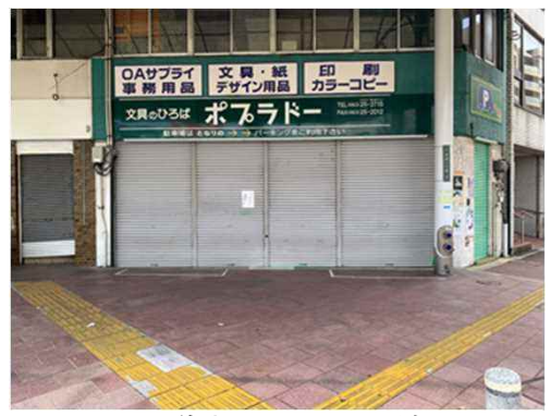
(市道本通2丁目1号線)