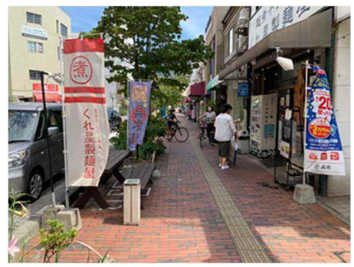
(市道呉駅前本通1丁目線)