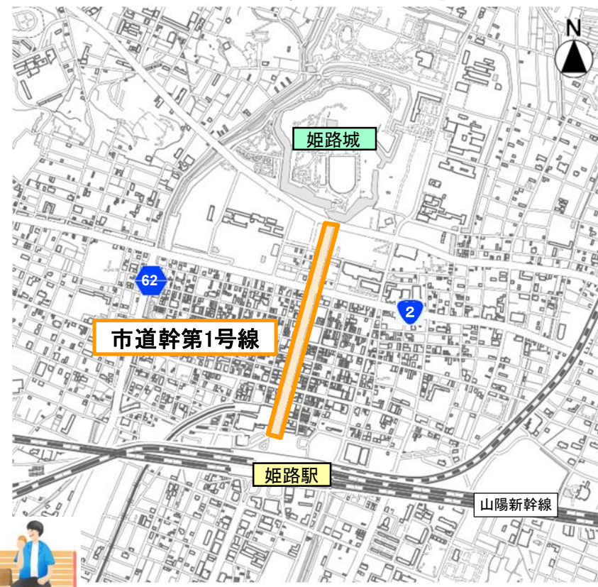
オレンジ：歩行者利便増進道路