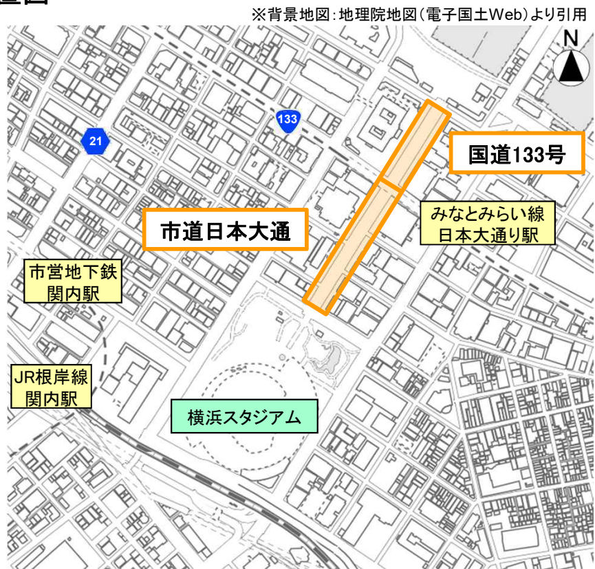
橙囲: 歩行者利便増進道路