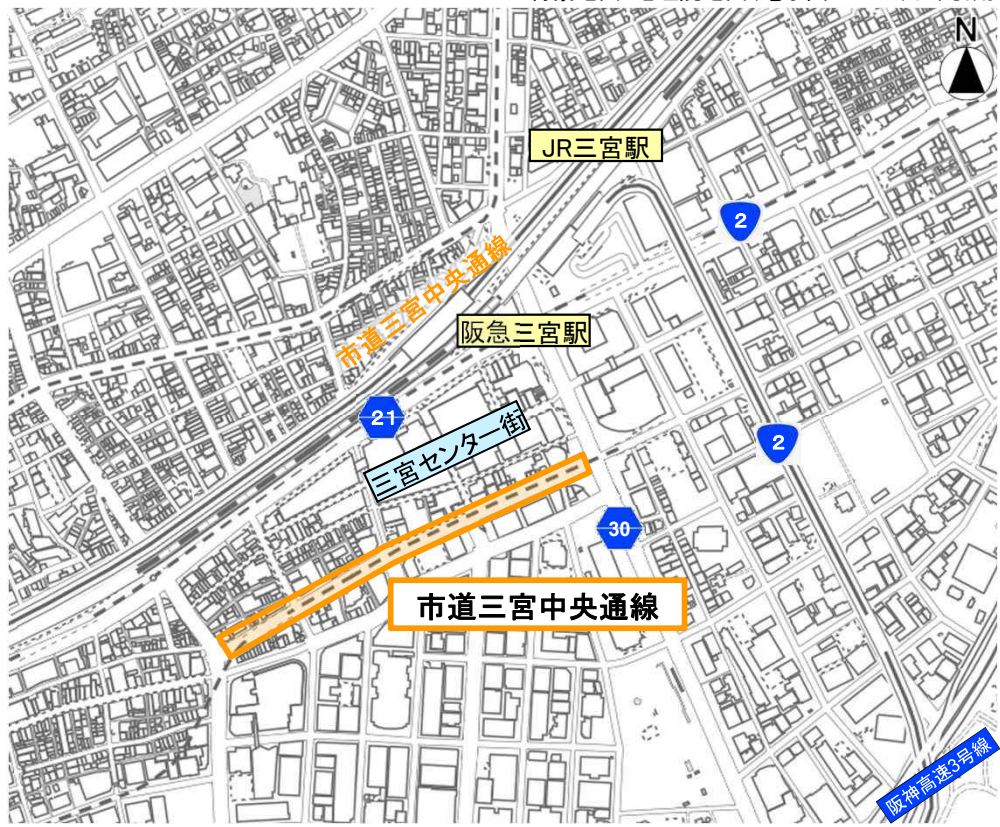
橙囲: 歩行者利便増進道路